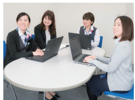
女性社員の登用を積極的に行うなど、働き方改革を推進する丸文通商

同社では、「人財」という貴重な経 営資源を生かすために、今後も新し い取り組みを進めたいと話しており、 今年、サテライトオフィスを県外に一 カ所、既にオープンし、もう一カ所の 年内オープンも計画中です。ICTツ ールを活用したテレワークの導入も検 討中。ほか、法定では2年の時効で消 滅する消化できなかった年次有給休 暇を、20日分を上限にプールして自由 に使えるよう就業規則を改訂するこ とも考えていきたいとしています。